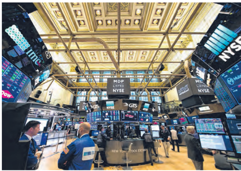
害怕错失良机的心理，促使投机者不断在股票市场回调时趁低买入，仿佛这一涨势将无限期地延续下去。(法新社)

在美国股票估值升至接近超级高昂的水平之际，我认为这次没有不同的是，投资者只关注价格而忽视价值的投资行为。事实上，这次应有不同的是，我们所采取的投资策略及管理投资组合的方式；我们应该非常谨慎地做出选择，而非不假思索地将下一个跌势视为另一个买入机会。